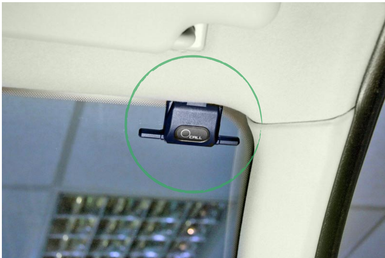
Правильная установка модуля приемопередатчика