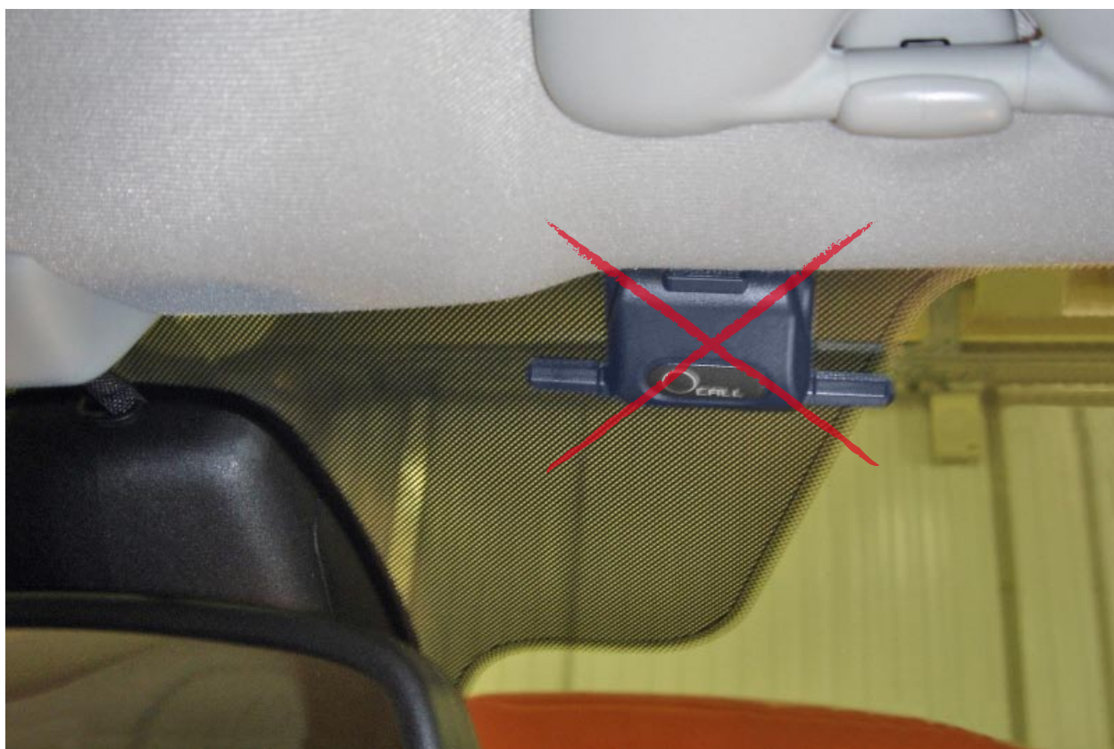
Неправильная установка модуля приемопередатчика

Следует учитывать, что лобовые стекла автомобилей Форд имеют встроенные нити обогрева, что может привести к самовозбуждению приемопередатчика.