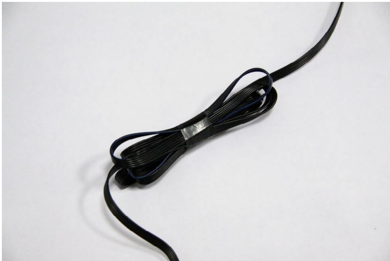
Излишки кабеля приемопередатчика, свернутые «восьмеркой»

2. Для исключения ложных срабатываний датчика удара не сматывать кабель датчика удара и кабель приемопередатчика в один жгут! Излишки кабеля приемопередатчика должен быть свернуты «восьмеркой» и закреплены отдельно от всех остальных проводов и кабелей сигнализации.