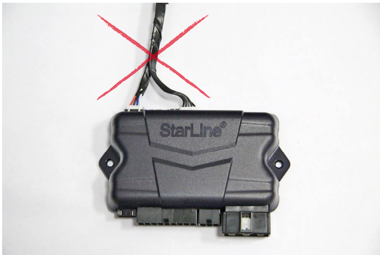
Неправильное расположение кабелей приемопередатчика и датчика удара