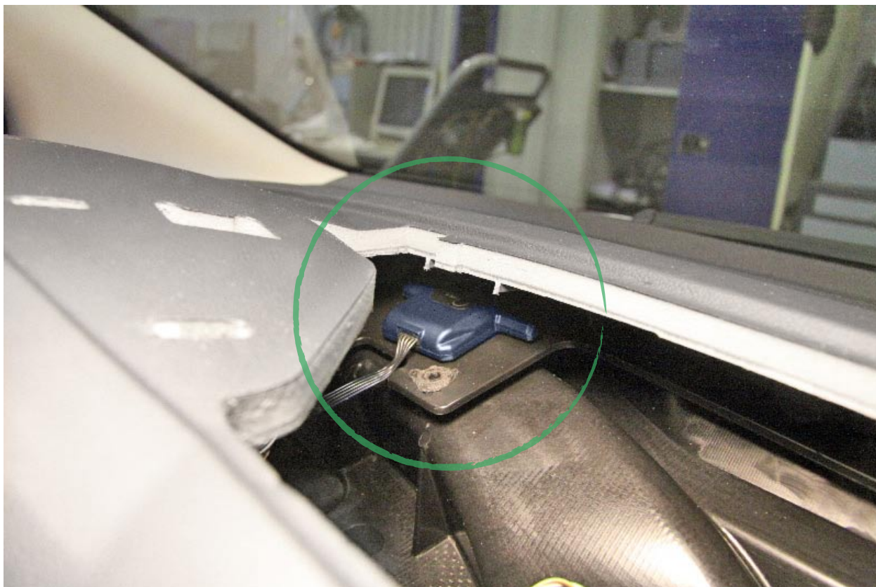
Установка модуля приемопередатчика под пластиковой накладкой в автомобиле Ford Focus